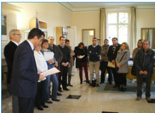
Cérémonie de remise des décrets de naturalisation et des déclarations de nationalité française par mariage à la Sous-Préfecture de Dreux