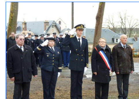
5 Décembre Journée Nationale d'hommage aux morts pour la France de la guerre d'Algérie et des combattants du Maroc et de la Tunisie

Le 6 novembre 2012, quatre jeunes euréliens, ont signé dans les salons de réception de l'Hôtel des Ligneris, leur contrat d'engagement dans l'Armée de terre, en présence de leurs familles, d'autorités civiles et militaires locales.