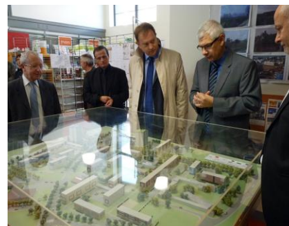
Visite cantonale à Châteaudun