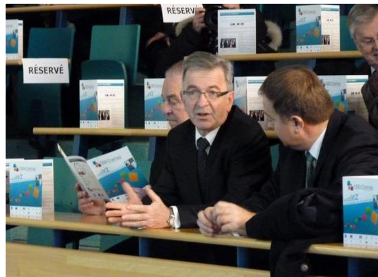
Le Préfet en conversation avec le Président du Conseil régional

A l'invitation du Président de la Chambre de Commerce et d'Industrie, le Préfet, le Député-Maire de Chartres, le Sénateur-Président du Conseil Général d'Eure-et-Loir et le Président du Conseil Régional ont inauguré le Premier Centre Européen d'Entreprise et d'Innovation créé dans la Région Centre. Cette nouvelle structure propose un service d'accompagnement personnalisé à la création et au développement d'entreprises innovantes ou à potentiel. Dans son intervention, le Préfet a insisté sur l'importance de ce type de structure au moment où le chômage bat des records dans le département. Il a également souligné le soutien financier apporté par l'Union Européenne à ce projet.