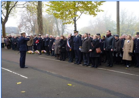
Cérémonie du 11 novembre à Chartres